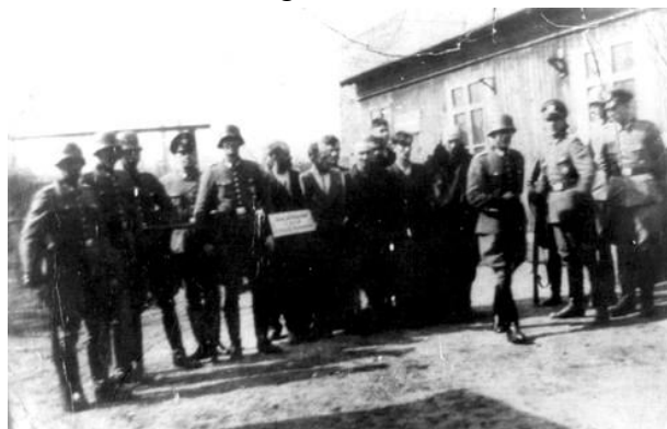
Przed egzekucją Żydów w Ozorkowie 10 kwietnia 1942 roku.

innych okolicznych miejscowości. W getcie znajdowało się łącznie ok. 4700 Żydów. Likwidacja getta rozpoczęła się w marcu 1942 roku i trwała do 20/21 sierpnia tegoż roku (2500 osób wywieziono do Chełmna nad Nerem, a ok. 1827 osób trafiło do getta w Łodzi).