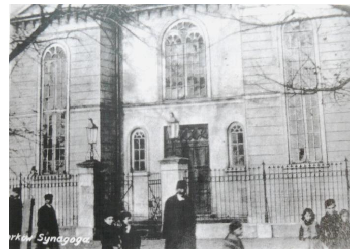
Synagoga w Ozorkowie ul. Piłsudskiego 12 (obecnie kard. S. Wyszyńskiego)

Pierwsi osadnicy żydowscy pojawili się w mieście w niedługim czasie po nadaniu praw miejskich wsi Ozorków w 1816 roku. Po niespełna trzech latach powstała gmina żydowska. Dalszy wzrost populacji wyznania mojżeszowego był spowodowany rozwojem przemysłowym miasta oraz odpowiednimi warunkami prawnymi jakie zapewnił właściciel Ignacy Starzyński. Te czynniki sprawiły, że w niedługim czasie ludność żydowska osiągnęła blisko 50% populacji mieszkańców dziewiętnastowiecznego Ozorkowa. Społeczność żydowska znacząco dominowała w sektorze handlowym i przemysłowym, co miało istotne przełożenie na rozwój wielu miast w zaborze rosyjskim, w tym Ozorkowa.