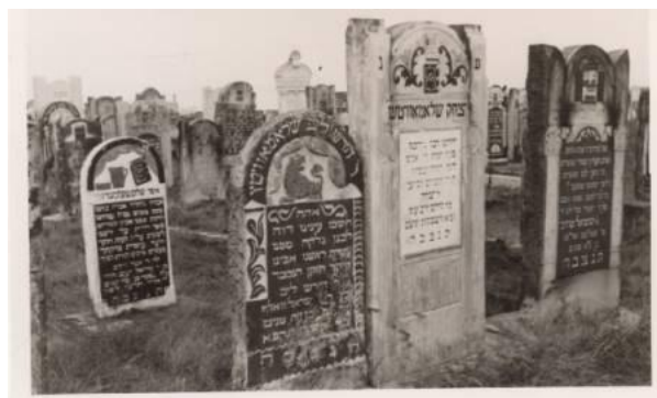
Kirkut (Kirhol) w Ozorkowie