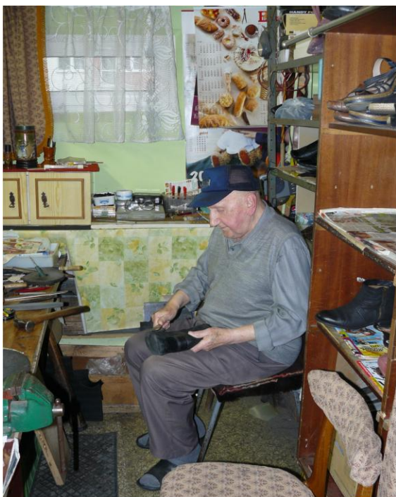
Warsztat Zygmunta Tatarowicza ulica gen. W. Sikorskiego 28 (3 klatka schodowa)