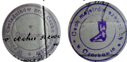
Stemple pieczęci Cechu Szewskiego z lat 1929-1939

W pierwszej kolejności rodzice szukali opiekuna-mistrza dla przyszłego ucznia (terminatora), który to sporządzał umowę, następnie dokonywano stosownego wpisu do księgi uczniów Cechu Szewskiego. Edukacja trwała 3 lub 4 lata, choć majster mógł przedłużyć okres przyuczenia do zawodu z powodu niewystarczającego opanowania kunsztu szewskiego przez terminatora. Następnie uczeń zdawał egzamin na czeladnika. Po pewnym czasie czeladnik mógł zostać wyzwolony, lecz na podstawie prawa był on zobowiązany pracować dalej w wybranym przez siebie zakładzie szewskim. Oczywiście czeladnik miał prawo przystąpić do egzaminu na majstra. Czeladnik wykonywał parę butów, która była oceniana przez komisję egzaminacyjną. Po pozytywnie zdanym egzaminie był on wpisywany do Księgi Majstrów Cechu Szewskiego. Po otrzymaniu dyplomu mistrzowskiego mógł on założyć własny warsztat, poza tym wchodził w skład Zgromadzenia Cechu Szewskiego miasta Ozorkowa oraz miał prawo do przyuczania do zawodu. W latach 1846-1907 wpisano do księgi uczniów cechu szewskiego 430 terminatorów, do księgi majstrów cechu szewskiego z lat 1852-1929 zapisano 159 majstrów.