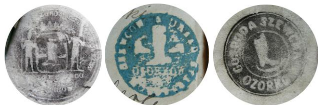
Stemple pieczęci Zgromadzenia Cechu Szewskiego w Ozorkowie z lat 1820, 1870-1914, 1900-1929

W latach 1846-1918 do Zgromadzenia Cechu Szewskiego należeli szewcy różnych wyznań religijnych (katolicy, ewangelicy, prawosławni i wyznania mojżeszowego).