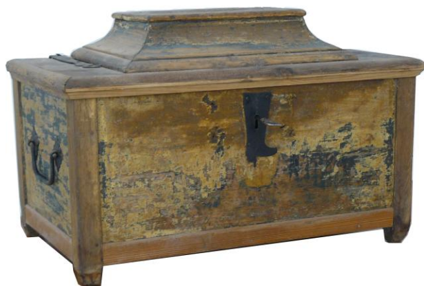
Skrzynia Zgromadzenia Cechu Szewskiego z Ozorkowa z I poł. XIX wieku

Na czele Zgromadzenia Cechu Szewskiego stał starszy cechu oraz jego zastępca podstarszy. Wybór władz cechu był dokonywany na podstawie kreskowania . Wygrywał ten kandydat, który osiągał największą liczbę kreszek. Po wyborze starszy cechu przejmował skrzynię cechową wraz z pieczęcią cechu i całą dokumentacją.