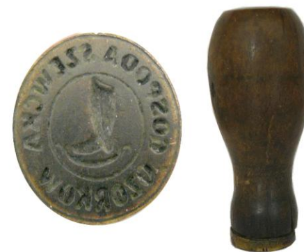
Pieczęć Cechu Szewskiego w Ozorkowie

zaś sami szewcy i inni rzemieślnicy z terenu miasta zostali skupieni w Powiatowym Związku Cechów Rzemieślniczych w Łęczycy. W połowie lat siedemdziesiątych, po reformie administracyjnej państwa, szewcy zaczęli podlegać pod Cech Rzemiosł Różnych w Zgierzu. Obecnie w Ozorkowie działają dwa warsztaty szewskie.